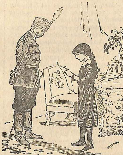
«Διάβασε μόνη σου» (Σελ. 58, στ. α'.)

δὲν εἶναι διατεθειμένος ν' ἀνεχθῇ περισσότερο μιὰ βασίλισσα μὲ τέτοια ἐλαττώματα;