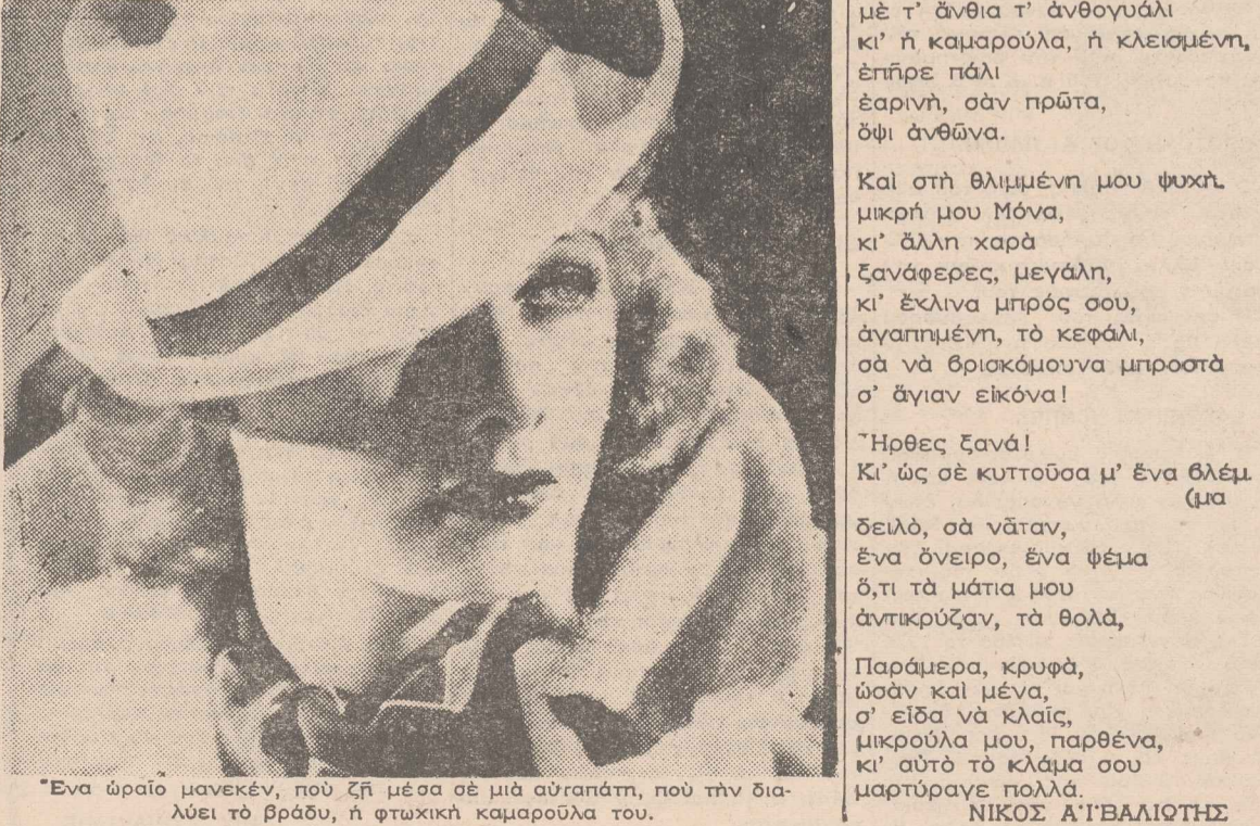
Ένα όμορφο μανεκέν, που ζει μέσα σε μία αυλαία, που την διαλαλεί το βράδυ, η φωτεινή καμπαρούλα του.

Και μη νομίζετε ότι το επάγγελμα αυτό είναι επιπόλαιο. Διότι τότε θα καταλήγαμε εις το συμπέρασμα ότι και η γυναίκα μόδα είναι κάτι το επιπόλαιο.