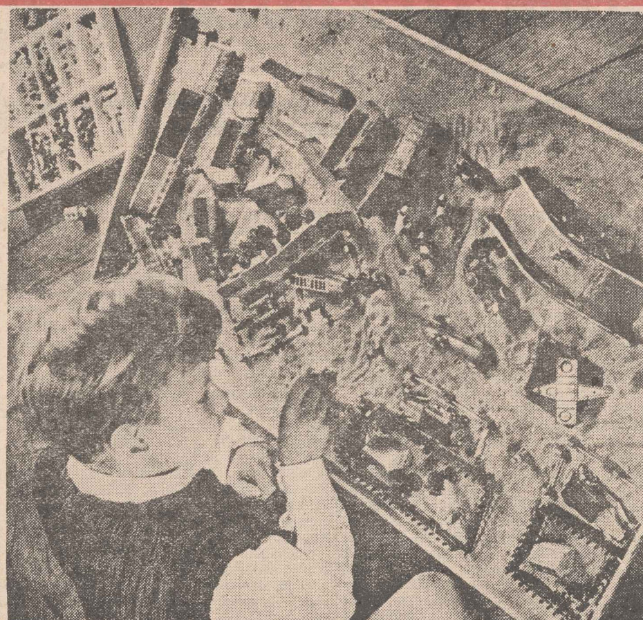
ΦΑΝΕΡΩΝΟΥΝ ΤΟΝ ΧΑΡΑΚΤΗΡΑ ΤΟΥ