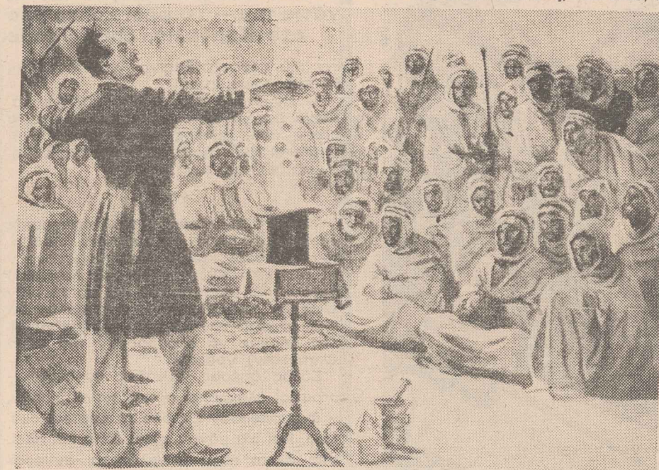
Ο τυχοδιώκτης, που εγόητευσε τους Μαραμπίους...