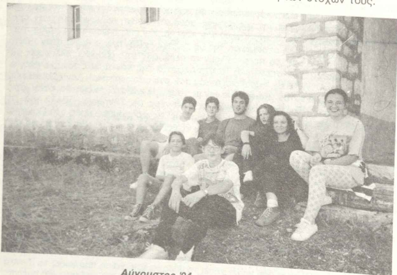
Αύγουστος '94 στον Αη-Γιώργη.

Φυσική συνέπεια της γνώσης και της καλλιέργειας είναι η κοινωνική συνείδηση, που θεωρείται απαραίτητη