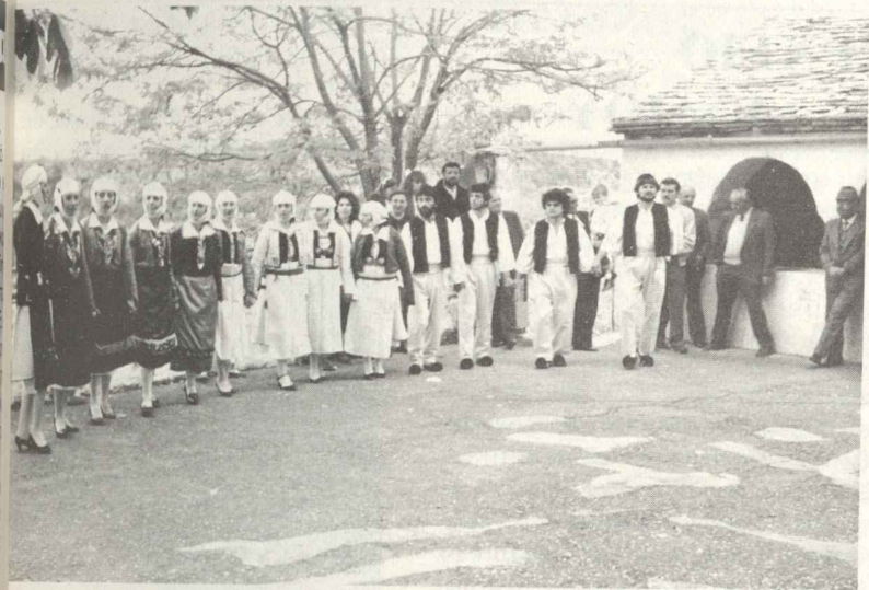
Πανηγύρι 1986. Οι νέοι και η παράδοση.

Η απόφαση του δικαστηρίου αναμένεται. Όποια όμως και αν είναι, η θέληση των κατοίκων να φράξουν το δρόμο σε οποιαδήποτε ενέργεια που δείχνει έλλειψη σεβασμού προς αυτούς και το χωριό τους, είναι δεδομένη και ακαταμάχητη.