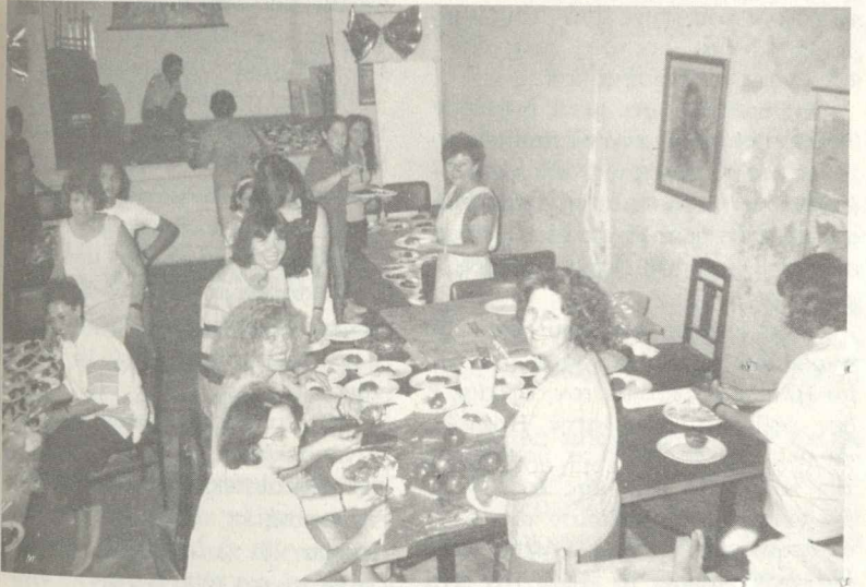
Κολοκάρι 1993. Προετοιμασία «τραπεζιού». (Για να παραδειγματίζονται οι νεότεροι.)

οι ώριμοι. Η ασυνέπεια λόγων και έργων, που χαρακτηρίζει τους ώριμους σε βασικά θέματα, προκάλεσε απογοήτευση στους νέους. Και επειδή οι σύγχρονοι νέοι έχουν μια ωριμότητα αυξημένη σε σχέση με τους νέους άλλων εποχών, οδηγήθηκαν σε μια γενική κριτική της αντίληψής τους.