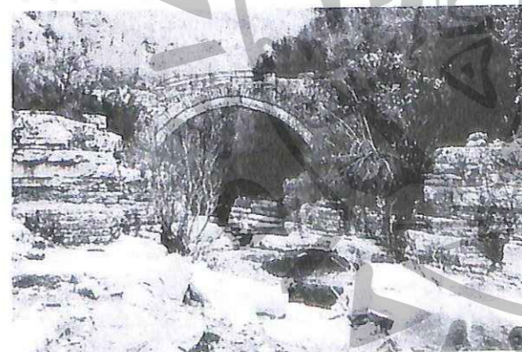
Το γεφύρι στο λάκκο (Ρογκοβό) μεταξύ Μικρού-Μεγάλου Παπίγκου

Εκεί λίγο πιο πάνω, στη στροφή του δρόμου οι οβίρες. Το Ρογκοβό.