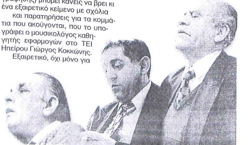
Εξαιρετικό, όχι μόνο για