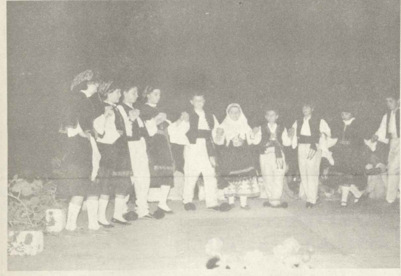
Μια άποψη του μικρού χορευτικού συγκροτήματος της Ομοσπονδίας από τις εκδηλώσεις των ΚΑΠΗ Κηφισιάς-Αμαρουσίου.

* Στα πλαίσια της Κοινωνικής προσφοράς και αλληλεγγύης με άλλους συλλόγους η Ομοσπονδία μας έλαβε μέρος στις πολιτιστικές εκδηλώσεις των ΚΑΠΗ Κηφισιάς-Αμαρουσίου κατά το τριήμερο 25-27 Μαΐου, με την εμφάνιση του μικρού χορευτικού συγκροτήματός της.