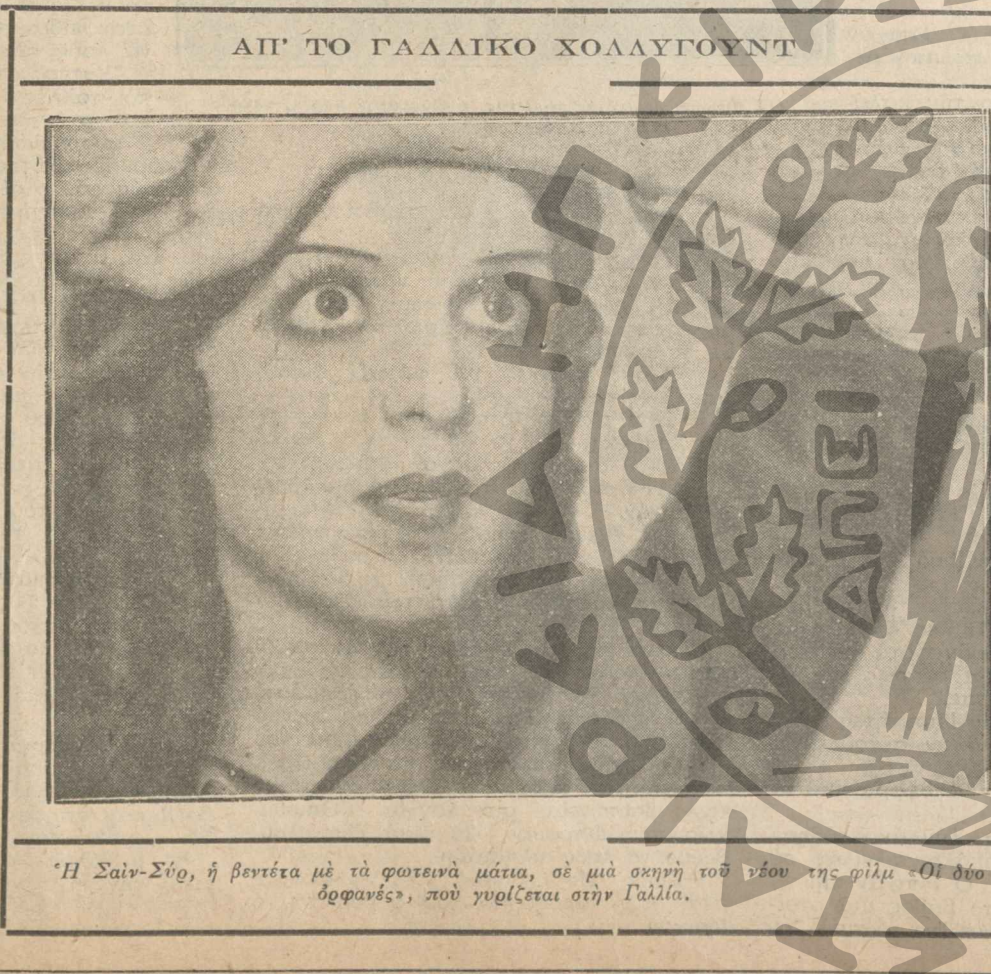
Η Σαιν-Σίγ, ή βεντέτα με τα φρενιά μάτια, σε μια σκηνή του νέου της φιλή «Οι δύο όμορφες», που γυρίζεται στην Γαλλία.