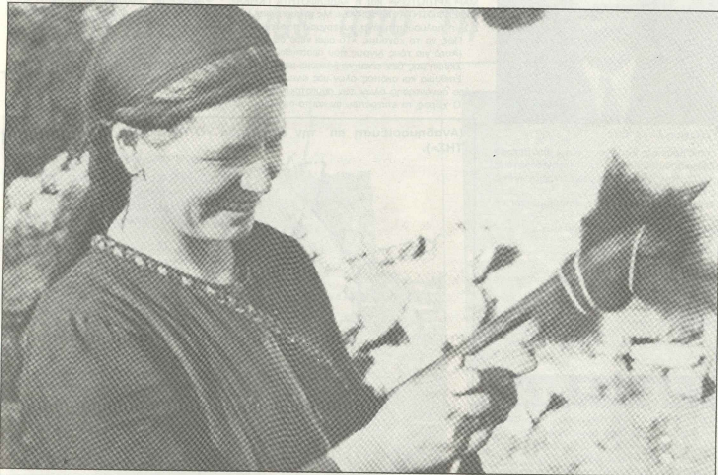
ΜΑΡΓΑΡΙΤΙ: Η ΓΥΝΑΙΚΑ ΜΕ ΤΗ ΡΟΚΑ