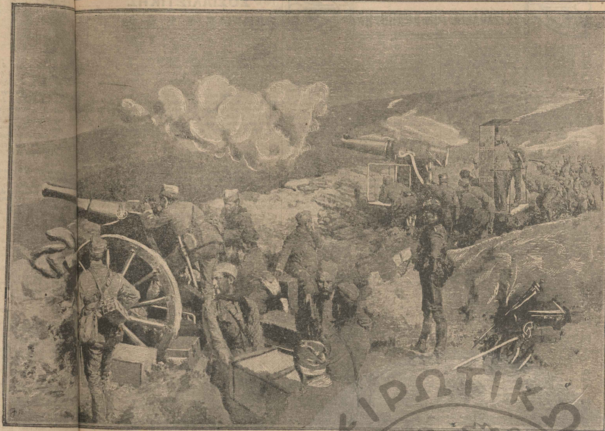
Βαθὸν Σερβικὸν πυροβολικὸν ὑπερασπίζον τὴν στρατηγικωτάτην γραμμὴν τοῦ Κ. Κραγιούβεγας. τὴν ὁποίαν παρεβίασαν οἱ Αὐστρογερμανοί, ἀπετέλει μίαν τῶν σπουδαιοτάτων ἀμυντικῶν ἐγκαταστάσεων τῶν Σέρβων