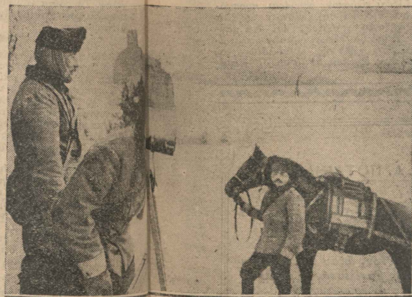
Ἡ Αὐστρογερμανῶν ἐν Σερβίᾳ Αὐστρῶν κατοπτρεύοντες Σερβικὰς θέσεις.