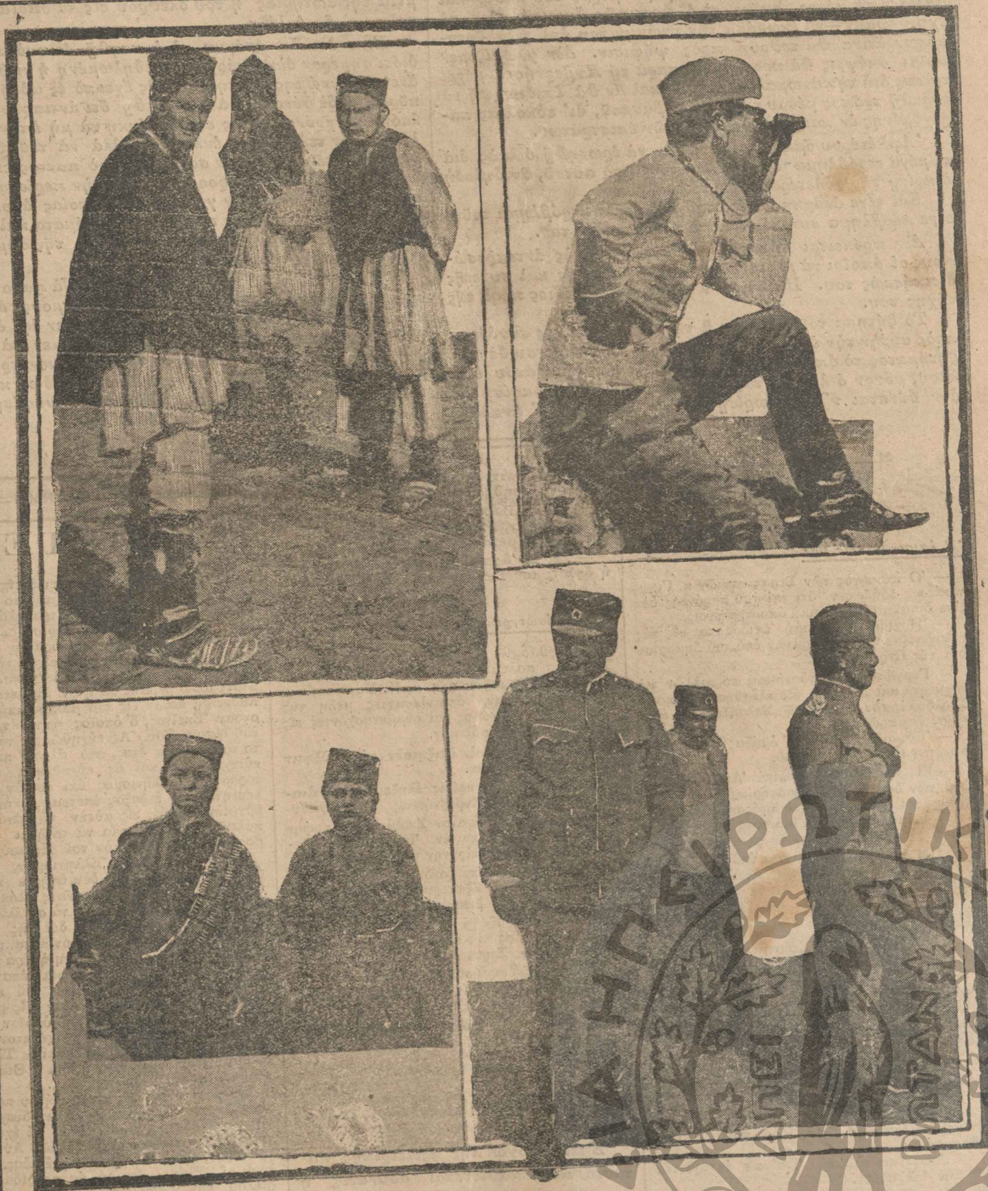
"Ανω αριστερά.—Σέρβοι τῶν νεωτέρων ἡλικιῶν προσερχόμενοι πρὸς κατάταξιν.—Κατω αριστερά.—Νεοὶ Σέρβοι ὀπλισμένοι ἔτοιμοι γὰρ μεταβῆναι εἰς τὴν μάχην.—'Ανω δεξιὰ.—'Ο στρατηγὸς Μίσσιτς κατοπτρεύων ἀπὸ τῶν ὑψώματων τοῦ Βελιγράδου τὴν ἐναρξίν τῶν ἐχθροπραξιῶν.—Κατω δεξιὰ.—Τὸ Γενικὸν στρατηγεῖον τῶν Σέρβων. Διακρίνονται δεξιὰ ὁ στρατηγὸς Μίσσιτς καὶ ὁ ταγματάρχης Βόσιτς ἐκ τῶν μάλλον διακεκριμένων ἀξιωματικῶν τοῦ Σερβικοῦ στρατοῦ.