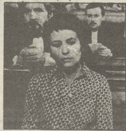
«Πεθαίνο από αγάπη» Ψυχολογικό δράμα γαλλικής παραγωγής 1970. Σκηνοθέτης: Αντρέ Καζιτ Παίζουν: Ανί Ζιραντό, Μπρούνο Πράντλ κ.α.