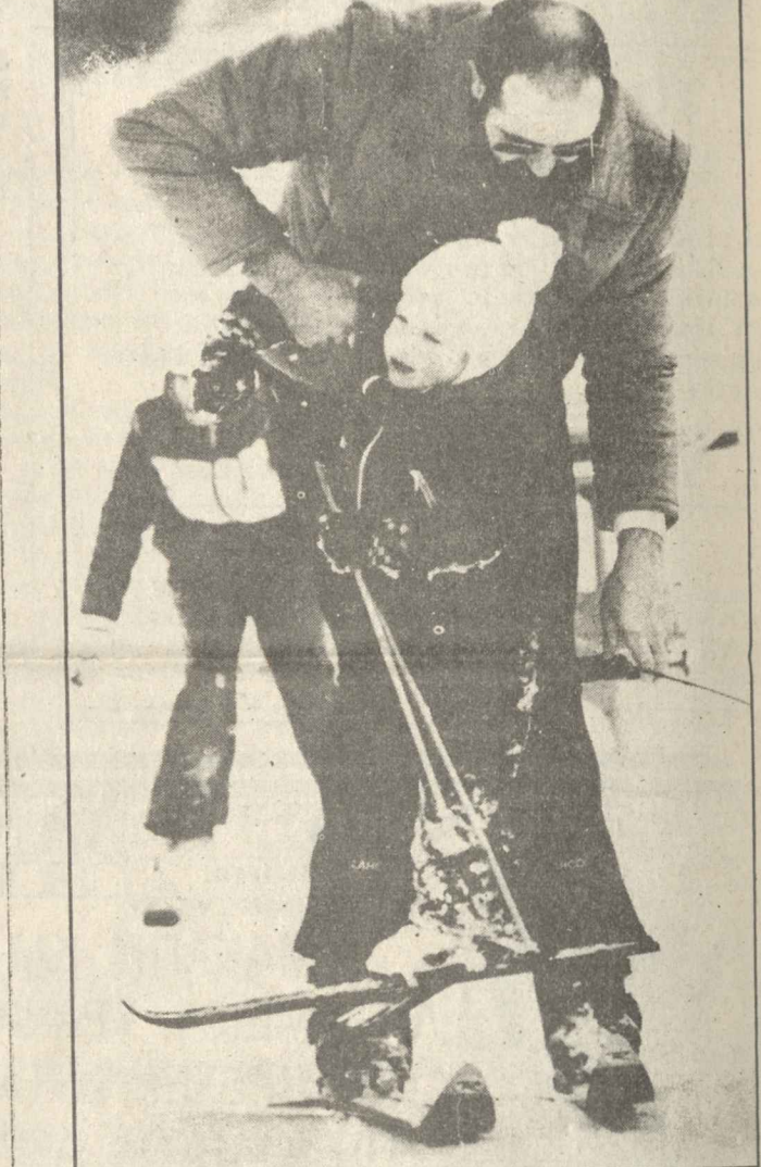
Από 2 χρόνων για σκι

Ενας μαθουσαλάς του ποδοσφαίρου, ο 41χρονος Σουηδός Μπρον Νόρντκβιστ αποφάσισε να εγκαταλείνει για τη γήπεδα. «Θέληση για να παίξω κι άλλο, έχω. Όμως τα πόδια μου, δεν υπακούουν τόσο στη θέλησή μου». Υπάρχει μια δόση πίκρας στα λόγια αυτά του Νόρντκβιστ, αλλά επίσης κι η συγκίνηση για τα εντυπωσιακά ρεκόρ, που θα κρατά για καιρό ακόμα. Εκπών δεκαπέντε συμμετοχές στην Εθνική Σουηδίας, έχει πάρει μέρος σε τρία Μουντιάλ (1970, 1974, 1978), αρχηγός της εθνικής μέχρι τα 36 του χρόνια. Ένα εντυπωσιακό Παλιμαρέ Μοναδικό αν αναλογιστεί κανείς πως δεν είναι όπως ο