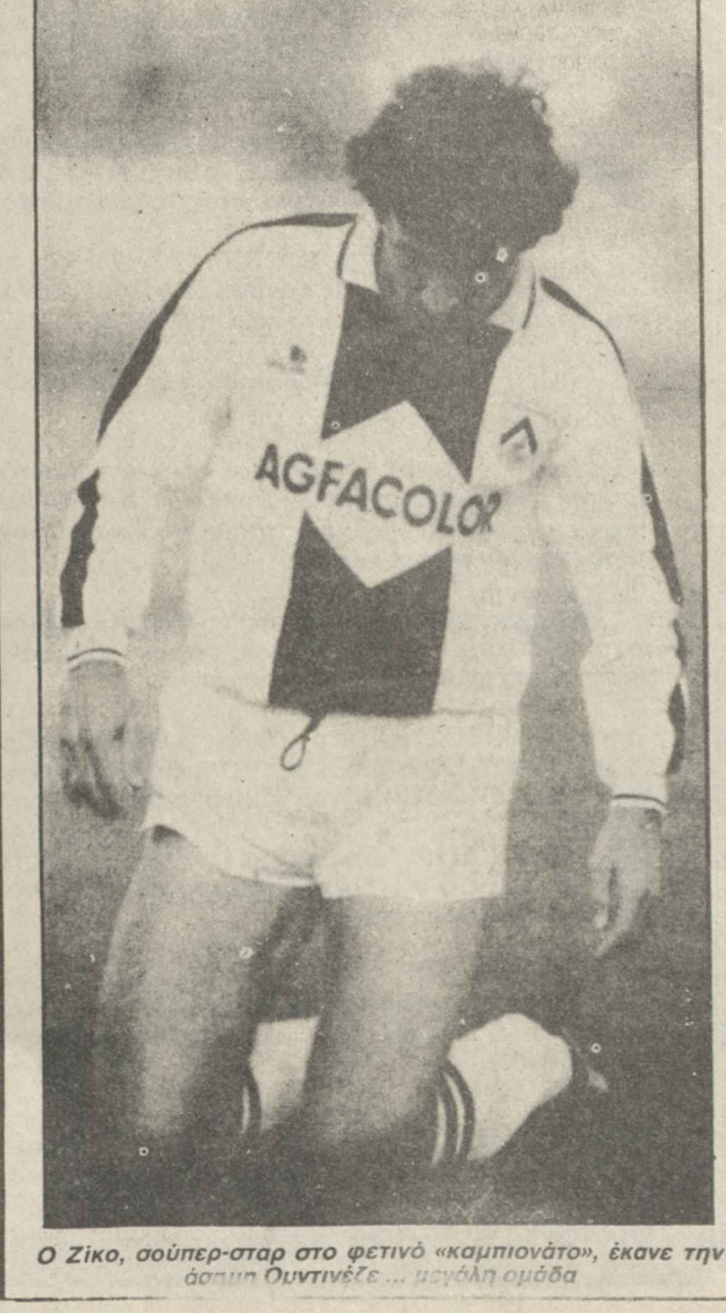
Ο Ζίκο, σούπερ-σταν στο φετινό «καμπιονάτο», έκανε την άσπρη Ουντινέζε... μεγάλη ομάδα

γκολ, ο πρώτος με 15 συμμετοχές (2 γκολ-πέναλτυ), ο δεύτερος με 16 (1 γκολ-πέναλτυ). Πίσω από τους δύο ξένους σκόρερς, είναι ο Πάολο Ρόσι, κανονίστερας του «Μοντιάλ 82», με 10 γκολ. Ανάμεσα σ' αυτούς τους τρεις παίχτες, θα γίνει σκληρή μάχη για τον τίτλο του πρώτου σκόρερ, στο φετινό πρωτάθλημα. Πολλές ομάδες άλλαξαν «φουσιονομία» με την απόκτηση ξένων παιχτών. Η Ρόμα κέρδιος (πέρα) το πρώτο θήμα, με ηγέτη τον Βραζιλιάνο Φαλκάο. Φέτος παρ' ότι ο δεύτερος ξένος της, ο Σερέζο, συμπατριώτης του Φαλκάο, δεν έδειξε ακόμη τον αληθινό εαυτό του. Η Γιουβέντους με κορυφαίο, στα περισσότερα παιχνίδια της τον Γάλλο Μισέλ Πλατινί, είναι πρωτοπόρος και δύσκολα θα της ξεριγεί ο τίτλος. Στη δυναμική της έχει και τον Πολωνό Μπόνικ, μια μονάδα μεγάλης αξίας. Οι Πλατινί - Μπόνικ έκαναν τη «Γιούβε» συγκρότημα πρώτης σειράς και πέρα την οδηγούσαν στον τελικό του Κυπέλλου πρωταθλητριών της Ευρώπης. Δύο άλλοι ξένοι, ο Αυστριακός Σάχνερ και ο Αργεντινός Χερνάντεζ, κάνουν διαμάχια στην Τορίνο, που βρίσκεται στο δεύτερο πόστο της βαθμολογίας με ένα βαθμό διαφορά, από την Γιουβέντους (23-22). Αξίζει να σημειωθεί ότι τα 10 από τα 18 γκολ που η Τορίνο έχει «πετύχει» μέχρι τώρα στο πρωτάθλημα, ανήκουν στους Σά-