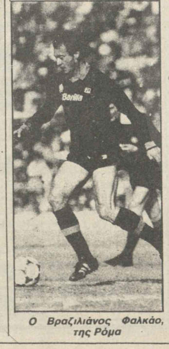
Ο Βραζιλιάνος Φαλκάο, της Ρόμα

χνερ, Χερνάντεζ (από 5 ο καθένας). Η Ουντινέζε ήταν μια άσημη ομάδα. Το 1982 αγόρασε τον Εντίνο και πέρα τον Ζίκο. Έτσι έγινε ένα σύνολο με «προσωπικότητα» και στα περισσότερα παιχνίδια της, γέμισε το στάδιο της Ουντινέ (χωρητικότητα 50.000 θεατών). Ο Ζίκο είναι ο «σούπερ-σταν» του φετινού «καμπιονάτο», ο παίχτης που ξεπερνάει τους Ιταλούς φιλάθλους.