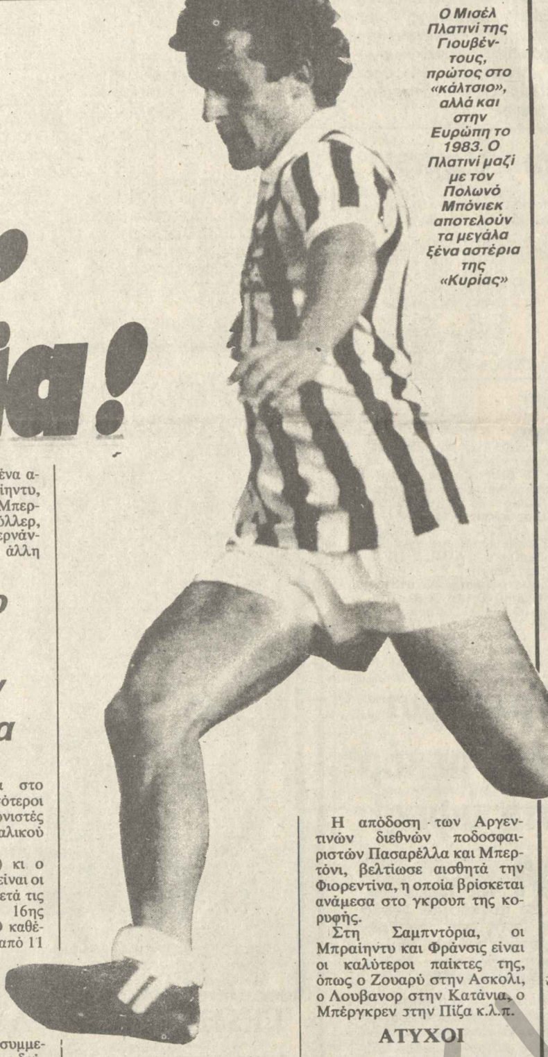
Ο Μισέλ Πλατινί της Γιουβέντους, πρώτος στο «καλτσίο», αλλά και στην Ευρώπη το 1983. Ο Πλατινί μαζί με τον Πολωνό Μπόνικ αποτελούν τα μεγάλα ξένα αστέρια της «Κυριας»

ροζ), μαζί με τα άλλα ξένα αστέρια (Πλατινί, Μπράιηντ, Φράνσις, Πασαρέλλα, Μπερτόνι, Μπόνικ, Μύλλερ, Μπλίσσετ, Σάχνερ, Χερνάντεζ κ.λ.π.), έδωσαν μια άλλη ομορφιά και γοητεία στο «καλτσίο». Οι πρώτοι-τεροι ξένοι είναι πρωταγωνιστές στους αγώνες του Ιταλικού πρωταθλήματος. Ο Ζίκο (Ουντινέζε) και ο Πλατινί (Γιουβέντους) είναι οι πρώτοι κανονίστερες μετά τις συναντήσεις της 16ης αγωνιστικής ημέρας. Ο καθένας του έχει σημειώσει από 11