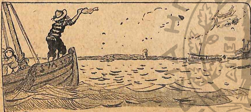
« Ἄφῃσε μὴ φωνὴ γεμάτη ἀπελπισία... » (Σελ. 241, στ. γ' )

— Εἴμαστε πολλὸ μικροῦ, φειθόρισε. κανεὶς δὲ θὰ μᾶς ἀκούσῃ. Ἀλλὰ τελοσπάντων, ἄς δοκιμάσομε.