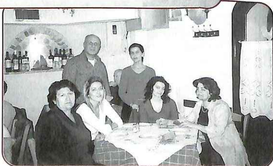
6-11-2005 Κέσσηρα Προτοζύριαχο