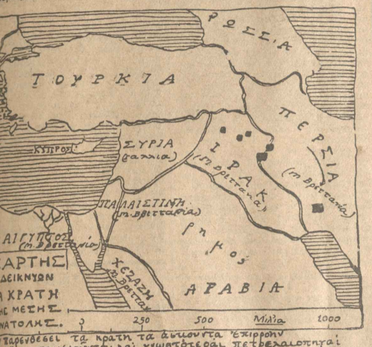
Παραθέσθαι τὰ κράτη τὰ ἀνατολικὰ ἐπίσημα ὡς ὅπου σηματοδοτεῖται ἡ γερμανοκρατία

Ἐπὶ τὴν ἐξουσίαν τοῦ Κιζιλίου, ἡ Παναγιώτατος Καταλιάνη, ἡ ἀνατολικὴ τὸν Κιζιλίου ἀνατολικῶν κινήσεων