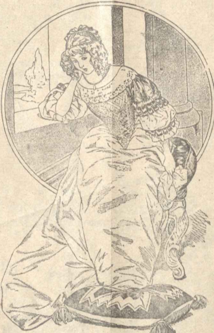
Πιέζε την ψυχή της κάποιος κακό προαισθημα...

Έπί τέλος, έπειτα από άρκετους μήνες, ο Ρολάνδος σηκώθηκε πια κι' έφυγε απ' τη φιλόξενη καλύτερη στην όποια είχε ξανάβρει την ήγεια και τη δύναμή του. Ένα φηνοπωρινό λοιπόν άπόγευμα, που η όμίχλη σκέπαζε την κοιλάδα του Ρήνου, χτύπησε την πόρτα του πεθερού του με συγκίνηση και λαχτάρα. Όταν ο κόμης Χέριμπερτ είδε μπροστά του τον Ρολάνδο δεν τολμούσε να πιστέψη στα μάτια του. Κι' όταν ο Ρολάνδος τον ρώτησε τι γίνεται η άρραβονιαστικά του, ο δυστυχισμένος έκλεισε πατέρας, δεν άποκρίθηκε άλλο σκέπασε με τις παλάμες το πρόσωπό του, για να κρύψει τα δάκρυα που έτρεχαν απ' τα μάτια του. 'Επί