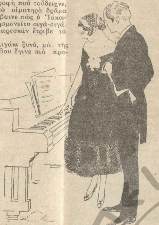
Ο άγαπηθούν πολύν γρήγορα...

— Πολύ καλά, δέχομαι οτι έχασε δικη, οτι ή παρατηρήσεις σου αυτές εινε σωστές. Μα τότε πές μου, θα το ξέρης βέβαια, ποιός θάνε ο έκλεκτός, ποιός θάνε ο τυχερός... του λαχείου αυτού του έρωτος; — Κανείς απ' όσους φιλοξενούνται σήμερα στην Επαυλή... — Κανείς!... — Ναι, μικρούλη μου, άπολύτως κανείς. Η 'Ιωάννα διαπεί βέβαια για μια καινούρια άγάπη. Μα ο έκλεκτός, ο τυχερός, ο άνημενός μου δεν ήθελε άκόμα... (Άκολουθεί)