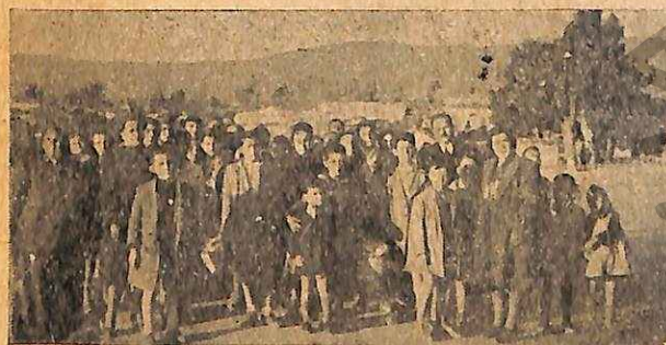
ΟΙ Ε. Σ. Ν. του Β' Δημ. Σχολείου Κορίνθου με δώρα για τους τραυματίας του Στρατ. Νοσοκομείου της πόλεως των. Juniors of the 2nd Public Elementary School, Corinth, with presents for the wounded in the Military Hospital of their town.