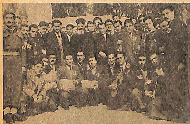
ΟΙ Ε. Σ. Ν. του 12ου Γυμν. 'Αρρέων 'Αθηνων εις το 4ον Στρατ. Νοσοκομειον Juniors of the 12th High School for boys, Athens, at the 4th Military Hospital.