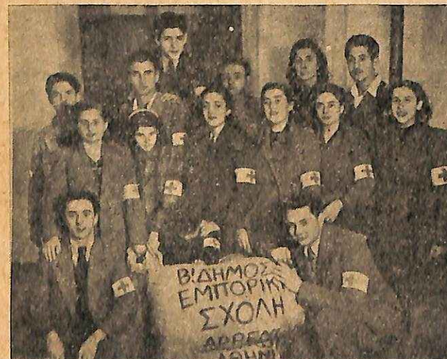
ΟΙ Ε. Σ. Ν. της Β' 'Εμπορικης Σχολης 'Αρρέων 'Αθηνων μεταφέρουν εις τα Γραφεία δέματα ιματισμου για τα παιδιά της Β. 'Ελλάδος. Juniors of the 2nd Commercial School, Athens, carrying to the Greek Junior Red Cross Offices parcels of clothing for the children in Northern Greece.