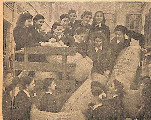
Ε. Σ. Ν. 'Εμπορικης Σχολης Θηλέων μεταφέρουν δέματα ιματισμου για τα παιδιά της Β. 'Ελλάδος. Juniors of the Commercial School for Girls carrying parcels of clothing for the children in Northern Greece.