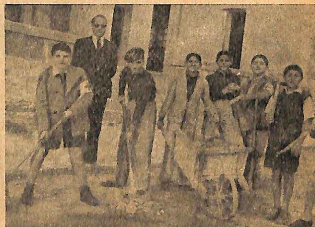
ΟΙ Ε. Σ. Ν. του Γυμνασιου Λουτρων Αιδηψου καθαρίζουν τον σχολικόν χώρον. Juniors of the High School, Aedipsos, ckening their school yard.