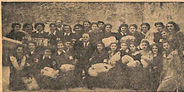
Ε. Σ. Ν. Τσιτσισιου Γυμνασιου 'Αθηνων με δέματα ιματισμου για τα παιδιά της Β. 'Ελλάδος. Juniors of the Tositsion High School, Athens, with parcels of clothing for the children in Northern Greece.