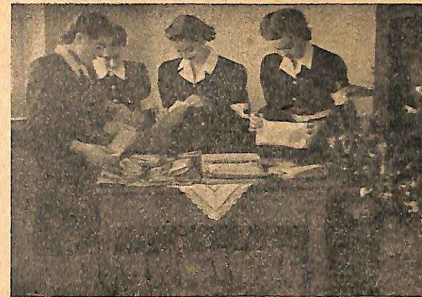
ΑΙ Ε.Σ.Ν. Γυμν. Θηλ. Καβάλλας ετοιμάζουν δέματα για τας άπόρους συμμαθητριάς των. Juniors of the High School for girls, Kavalla, preparing parcels for their destitute schoolmates.