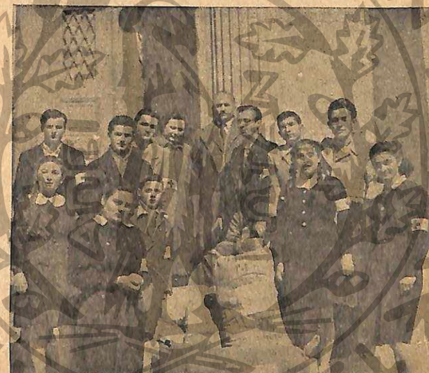
Ε. Σ. Ν. του Γυμνασιου Κορωπίου με δέματα ιματισμου για τα παιδιά της Β. 'Ελλάδος. Juniors of the High School, Koropi, with parcels of clothing for the children in Northern Greece.