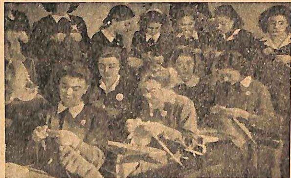
ΟΙ Ε. Σ. Ν. της Σχολης Καλπάκα 'Αθηνων πλέκουν πουλόβερ δια τον στρατον. Juniors of the Kalpaka School, Athens, knitting pullovers for the Army.