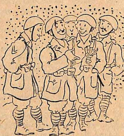
Έδειχνε πέντε φωτογραφίες